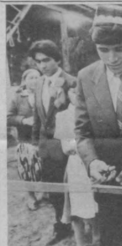
«Молодежи — прочные атеистические убеждения, передовую советскую образцовую культуру...» — под таким девизом проходил по Наманганской области специальный рейс агитпоезда «Комсомолец Узбекистана»...