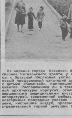
На окраине города Касансия, близ южных склонов Чаткальского хребта, у самой границы с братской Киргизией уютно разместился новый профилакторий для родителей с детьми «Касансия», принимающий пациентов. Расположился он в трех оригинальных архитектурных корпусах, оснащенных современными медицинскими инструментами и аппаратной, современной мебелью. Здесь не только идеальные условия — чистый воздух, прозрачные струи стремительной горной речушки Касансия.

положил начало серии лекций о технико-экономическом воздействии ирригаторов Узбекистана ангольским, мозамбикским, сирийским крестьянам в подлеме сельского хозяйства. (ТАСС).