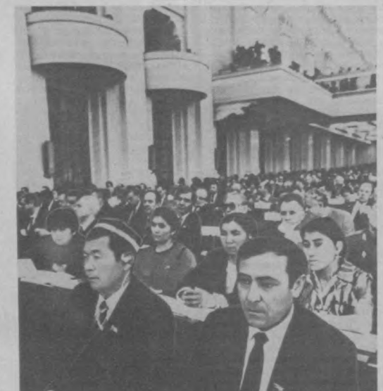
МОСКВА. 18 июня 1986 года. Пятая сессия Верховного Совета СССР одиннадцатого созыва. На снимке: депутаты из Узбекистана в зале заседаний.