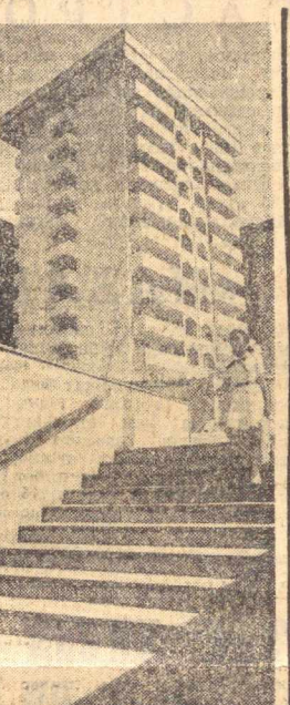
Республикамизда уй-қоқ кўриши нисли кўриладиган ламада олиб боришмоқда. Партия ва ҳукуматимизнинг меҳнаткашлар уй-қоқ шартини яхшилаш тўғрисидаги гамхўрлик СССР граждандарининг уй-қоқли бўлиш ҳуқуқини таъминлашга қаратилган сиёсати натижасидир...