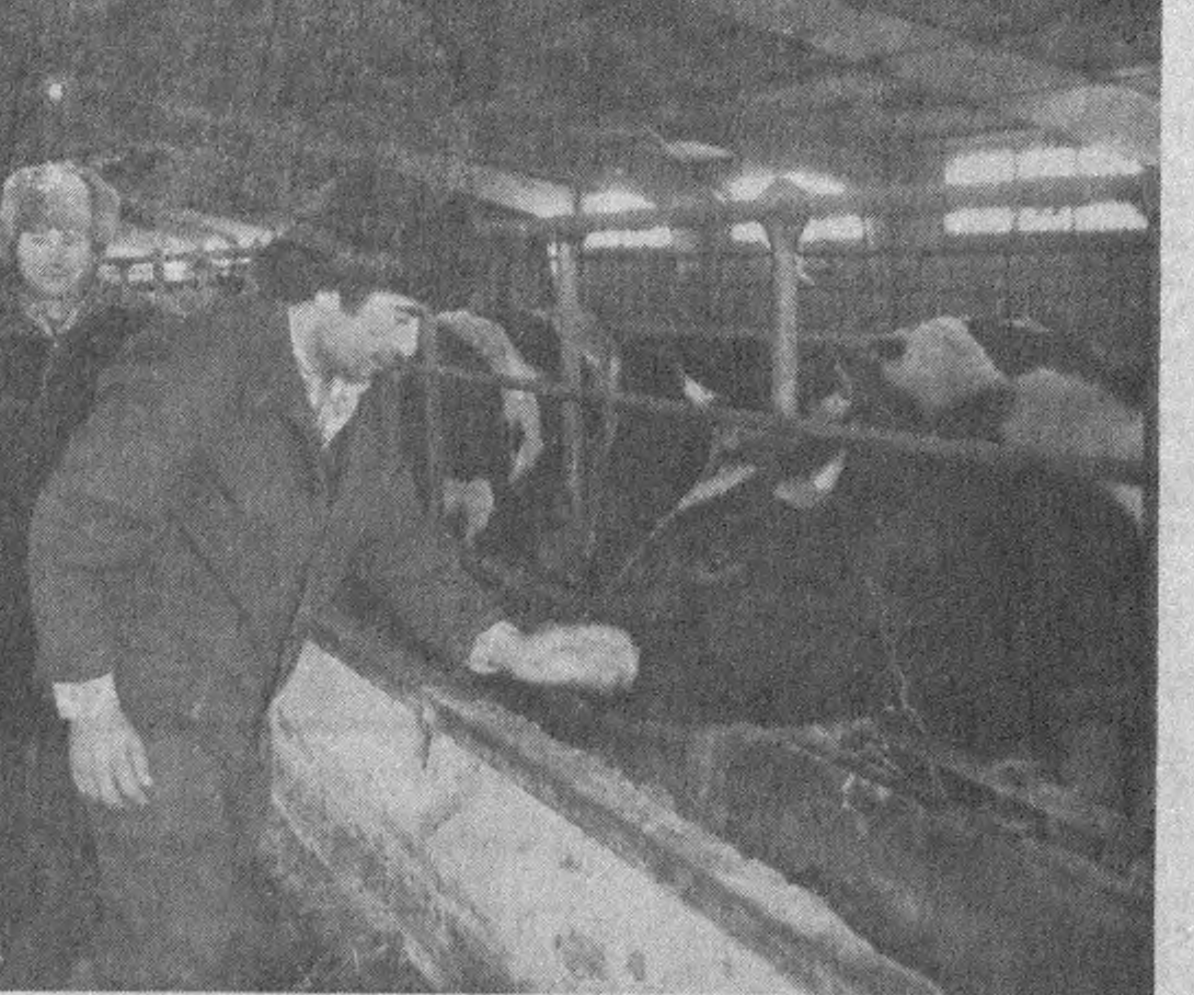
ИШИНГА ЯРАША ҲАҚ ОЛАСАН