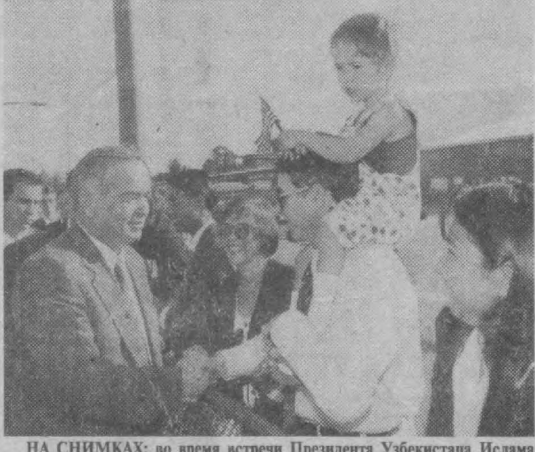
НА СНИМКАХ: во время встречи Президента Узбекистана Ислама Каримова с Президентом США Биллом Клинтон; церемония встречи Ислама Каримова в Министерстве обороны США; встреча на улицах.

Здесь представляется уместным вспомнить о некоторых аспектах развития узбекско-американских