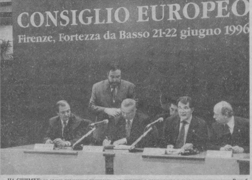
НА СНИМКАХ: во время церемонии подписания соглашения о партнерстве и сотрудничестве между Республикой Узбекистан и Европейским Союзом.

В резиденции ОПИК состоялась теплая и дружественная беседа Ислама Каримова о перспективах сотрудничества.