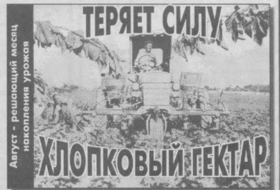
Хлопководы Самаркандской области четыре года подряд не выполняют госзаказ. За это время они недодали государству более 124 тысячи тонн хлопкового сырья. На 23,500 гектаров сократился посевной клин хлопчатника - в объеме одного хлопководского района. Урожайность снизилась на семь центнеров и составляет за предыдущие четыре года лишь 23,6 центнера.

Начиная с этого года в хлопководстве области наблюдаются проблемы. Отсыпались на заданированной площади, почти повсюду добились полноценности гектара. Все виды работ старались проводить в оптимальные сроки и на должном уровне. Особое внимание