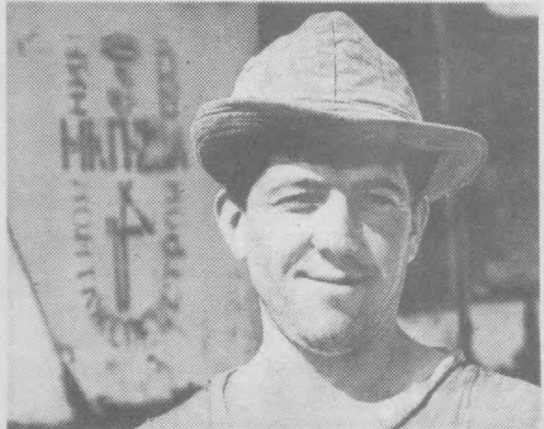
Недаром говорят: где прямая дорога, там и дела идут гладко. В эти дни строители Самаркандского комбината дорожно-строительных материалов государственного концерна "Узавтоуйл" прокладывают еще один новый участок дороги - осваивают перевал Таттикорча в Ургутском районе.