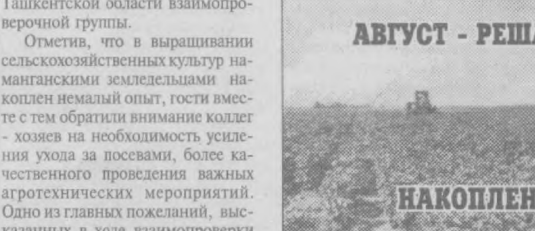
АВГУСТ - РЕШАЮЩИЙ МЕСЯЦ НАКОПЛЕНИЯ УРОЖАЯ