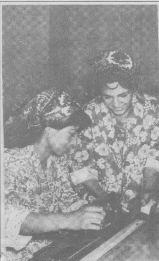
При байсонком торговом доме открылись новые швейные и вязальные цехи. С их вводом в эксплуатацию трудоустроилось около 60 человек.

Сурхандаринская область. Фото Ш.Шарапова (УзА).