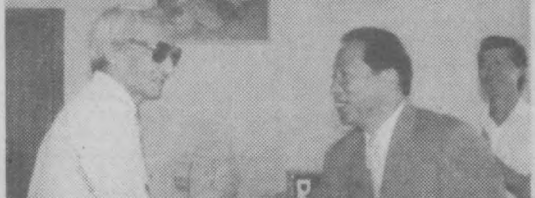
Вчера в редакции газеты "Правда Востока" собрались победители и призеры конкурса-викторины "Знаете ли вы Республику Корея?"

Вручены награды победителям и призерам конкурса-викторины