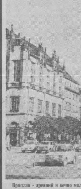
Вроцлав - древний и вечно молодой город Польши.

У госпожи Фера на этот счет свое мнение: появление "фальшивок" - дело нередкое, поскольку крупные магазины подвергают себя риску, покупая товар поделешеве у сомнительных оптовиков, игнорируя официальных дистрибьютеров фирмы-производителя. Да и покупателям же компания настоятельно советует отовариваться в специализированных магазинах настоящей фирмы.