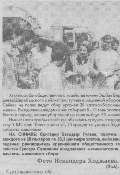
Сурхандарьинская обл.

Сегодня в большинстве хозяйств страны именно так относятся к делу: каждая технологическая операция в сельском хозяйстве должна быть выполнена качественно и в срок.