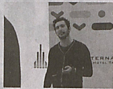
го конкурса TAF! На участие в нем подано 167 заявок.

1 < Масштаб проводимых в рамках форума мероприятий вырос вдвое по сравнению с прошлым годом. Так, 11 апреля во Дворце кино имени Алишера Навои состоится "ABC Show", в рамках которого можно на большом экране ознакомиться с лучшими образцами рекламных роликов и послушать комментарии специалистов. Запланированы выступления экспертов и демонстрация медиаконтента. А в "International Hotel Tashkent" в этот же день состоится II Центральноазиатский туристический форум "Гостеприимство 2.0: вызовы и решения" для профессионалов турбизнеса, также приуроченный к "Adweek". Рекламная конференция и Первый ташкентский фестиваль рекламы TAF! 12-13 апреля пройдут в концертном зале "Зарфашан", где лучшие представители сферы поделятся опытом и идеями. Финалом конференции станет разбор работ креативни-