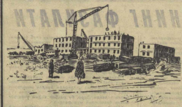
Б. Штин чиқарган расмлар.