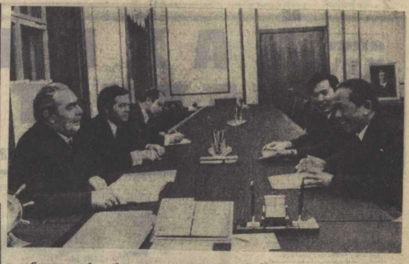
Суратда: суҳбат лайти.

Сурхондарё областининг меҳнатқашлари КПСС XXIV съезди тарихий қарорларини бажарадиган, 1975 йилги юксак мажбуриятларини бажариш учун социалистик мусобақани меҳнатқашлар билан табирилар муваффақиятларини муддатидан илгари, 30 октябрьда бажардилар. Давлат тайёрлаш пунктларига 425 минг тоннадан кўпроқ пахта етказиб берилди. Бу пахтанинг 196 минг тоннасини машиналар билан териб олинди. Пахта тайёрлаш беш йиллик халқ хўжалик плани 105,3 процент бажарилди. Беш йил мобайнида давлатга 20714 минг тонна, шу юмладан пландан ташқари 103,4 минг тонна пахта сотилди. Бу йил областда пахтанинг гоят кўп-матли илгичка талаби навларини этиштириш анча кўбайди. Жами тайёрланган пахтадан унинг илгичка талаби навлари 32 процентдан кўпрогини ёки 137 минг тоннасини ташкил этади. Бу эса ўтган йилнинг ана шу даврида тайёрлангандан 16 минг тонна кўбайди.