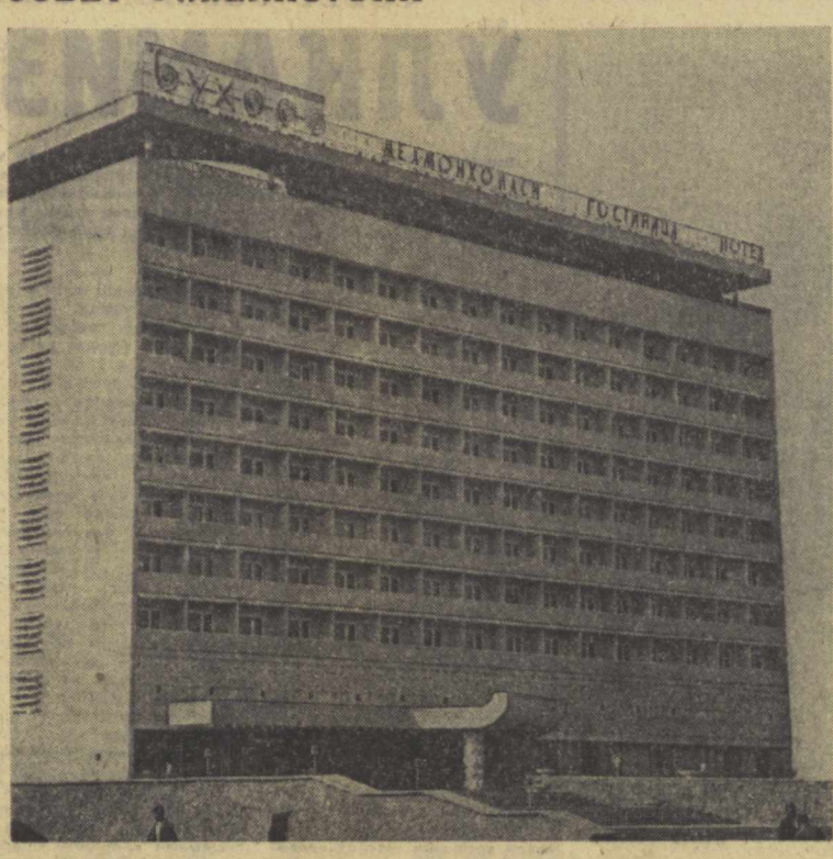
Суратда: Бухоро шаҳридаги «Бухоро» меҳмонхонаси.

Еш шаҳарнинг саноат қувватларини тез ошириш тақрибасан зўр қизқинча сазовор. Бу ерда Навоий ГРЭСи биринчи катта объект бўлди, унинг энергияси катта зона экономикасини ривожлантиришга ёрдам берди: ГРЭС заводларга, машина қаналарининг агрегатларига, колхозлар ва совхозларга энергия бермоқда. Табиий газ билан ҳаво минерал ўғит, нитронга айлан-