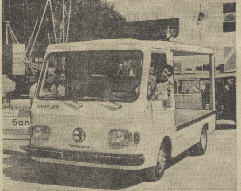
Софиядаги электрокарлар ва мотоцикарлар яратиш институтида кичик ҳажмли электро- мобиллар устида қўлдан бериш олиб борилоқда. Суратда: институтда яратилган «ЭЛМО-1000» электромобили. Бу машина Пловдивда ХХІІІ Халқаро ярмаркада олтин ме- даль билан тақдирланди.