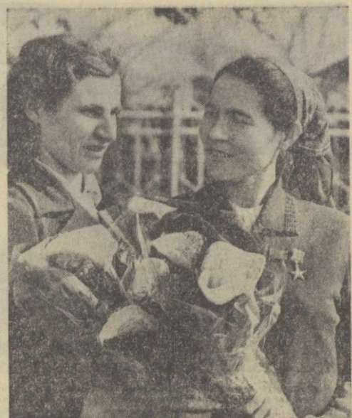
Эстониялик қаҳрамонлар учрашди. Бу учрашув худди сермавик дарёларнинг бири-бири билан туташганига эслатади.

Мухтарамаҳон юрса ҳам, турса ҳам ана шундай меҳр, ана шундай фидойиллиги орзу қиладиган бўлиб қолди.