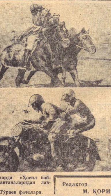
Суратларда «Ҳосил байрами» тапталанларидан лавҳалар.