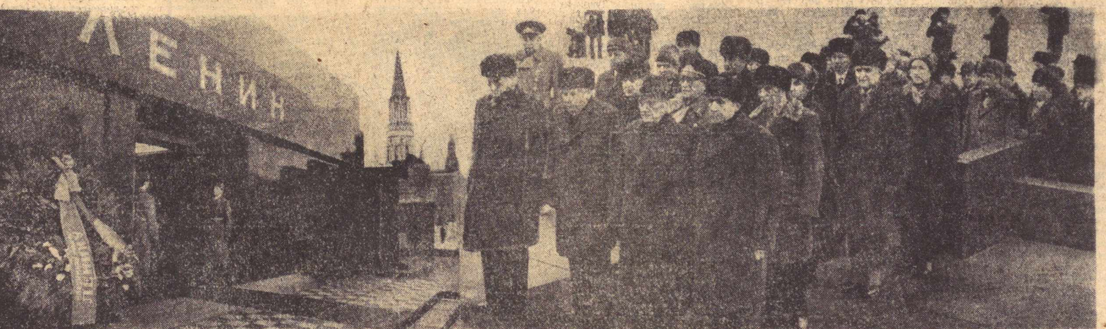
Коммунистик партия ва Совет давлатининг раҳбарлари В. И. Ленин Мавзолейига гулчамбар қўйишмоқда. В. Мусоьев, Э. Песофонов, ВЛКСМ делегациясиники.

Ўзбекистон ССР Олий Совети Президиуми Ўзбекистон ССР Олий Советининг депутаты, Самарқанд области Бетугур районидан «Ўзбекистон Компартия»