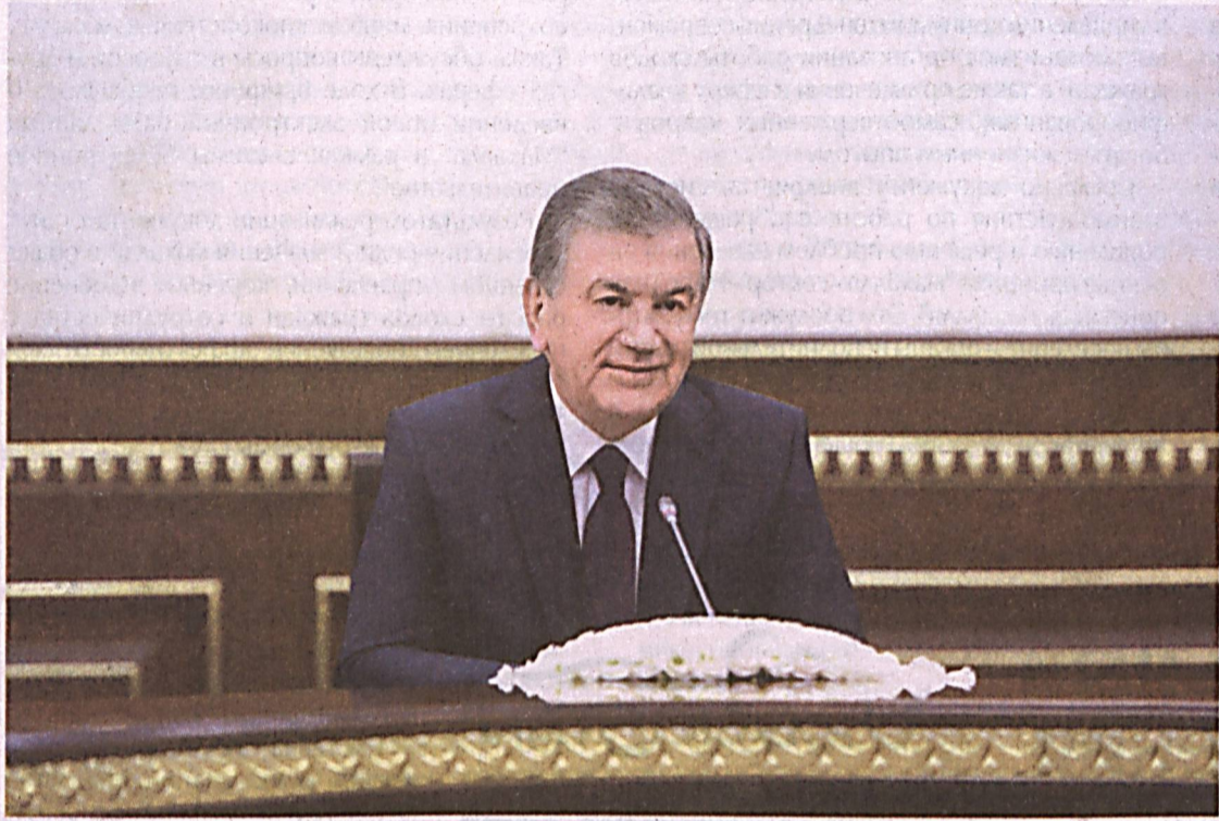
Президент Республики Узбекистан Шавкат Мирзиёев 16 апреля принял заместителя министра иностранных дел Соединенного Королевства Великобритании и Северной Ирландии Алана Дункана, находящегося в нашей стране с рабочим визитом.

Глава нашего государства, тепло приветствуя гостя, с глубоким удовлетворением отметил динамичное развитие узбекско-британских многоплановых отношений в последние годы.