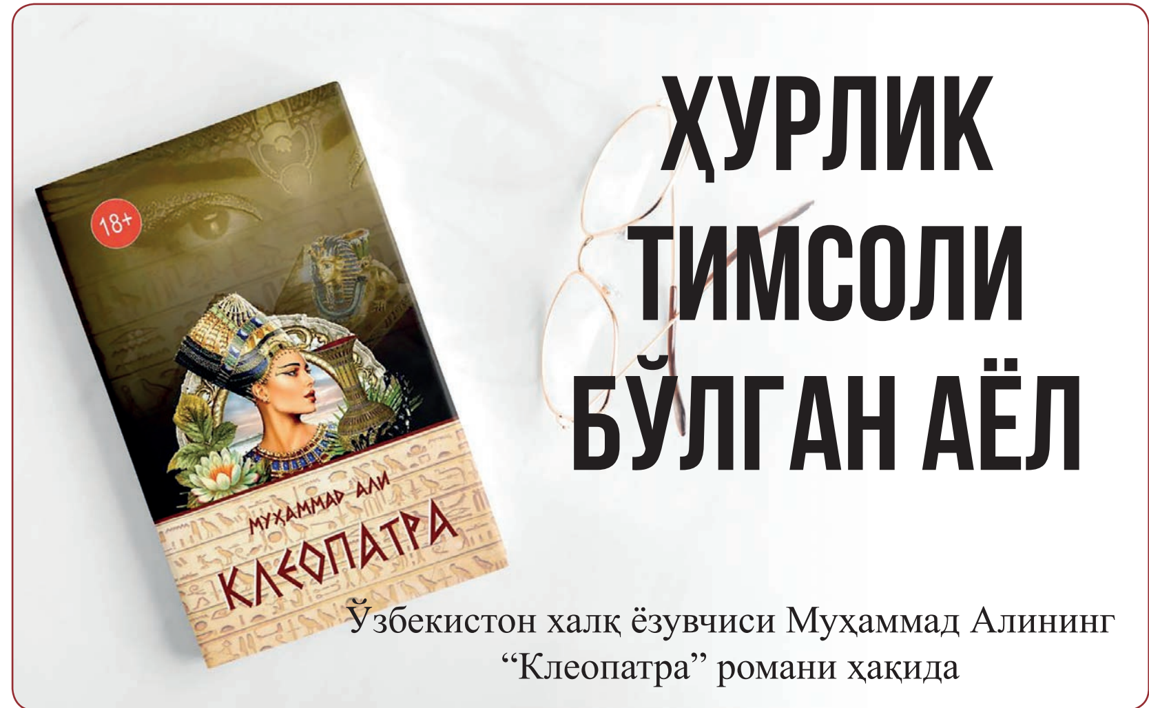
Ўзбекистон халқ ёзувчиси Муҳаммад Алининг “Клеопатра” романи ҳақида

ларни, яъни қўрқмаслик, ватанпарварлик, миллатпарварлик, фидойилик, севги садоқат, бошқарувчанликни кўради ва ўз қахрамонининг йиллар давомида жангу жадаллар, турли воқеалар силсиласида тобланиб, мамлакатни бошқарувчи ҳукмдор малика сифатида шаклланишига гувоҳ бўлади.