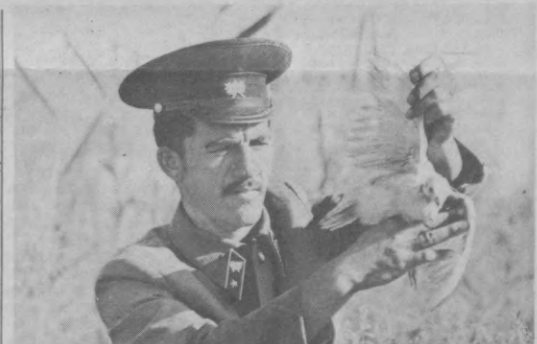
Сохранить неповторимую природу края, умножить ее богатства — такую миссию выполняют работники совхоза «Рассвет» Ворошиловского района.

Сейчас ученые института работают над созданием эффективного препарата для лечения вирусного гепатита «А» — наиболее распространенной формы болезни. (УзТАГ).