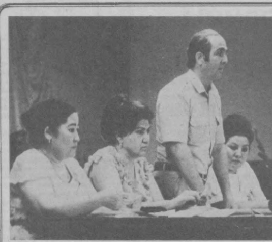
• Отчеты и выборы в профсоюзах