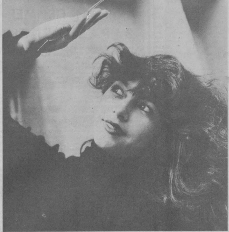
Солнце на ладони.

Ш. ТУГУШЕВ. Соб. корр. «Правды Востока». Ахунбаевский район.