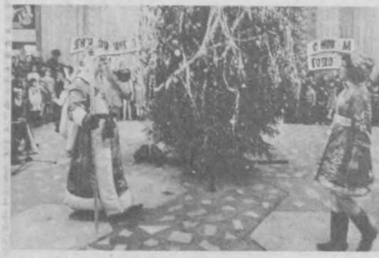
Всей школой на елку.