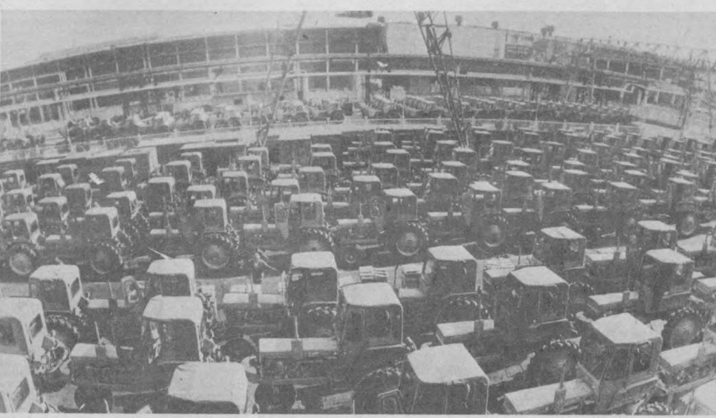
На отгрузочной площадке тракторного завода.

Но, решая задачи дни сегодняшнего, не упускаем из вида день завтрашний. Идет напряженная борьба за создание материально-технической базы для перевода производства на выпуск 100-сильного трактора хлопковой модификации.