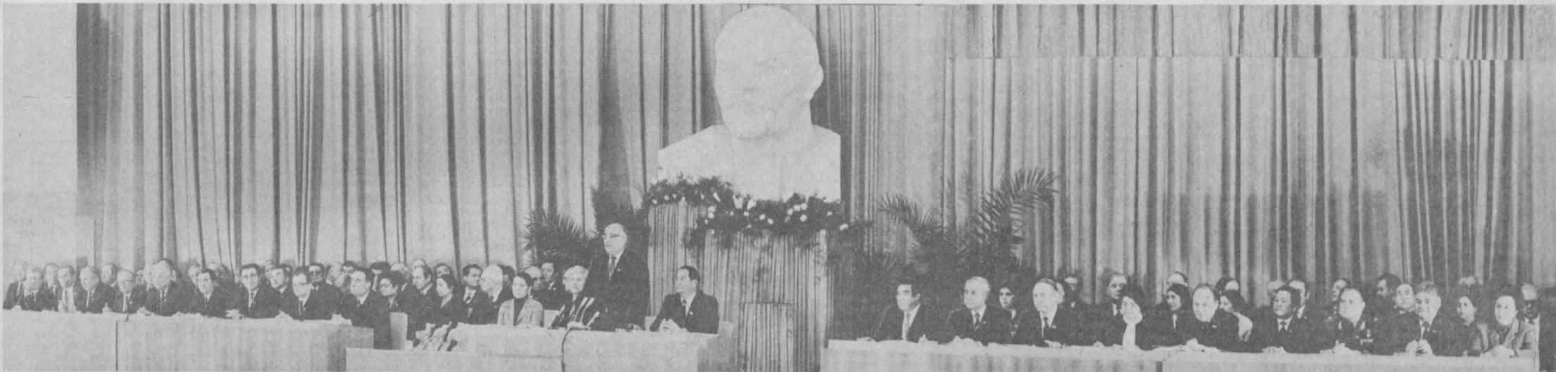
ТАШКЕНТ. На снимке: президиум заседания девятой сессии Верховного Совета Узбекской ССР десятого созыва.