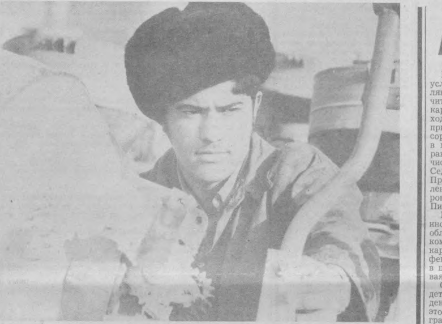
Высокими темпами ведут зимние полевые работы труженники совхоза-техникума имени Ленина Ленинского района. Здесь уже приступили к вывозу на хлопковые поля органических удобрений. До начала посевной на каждый из 4.600 гектаров плантации будет доставлено по 15 тонн органики. Занили боев

Закончилась продолжавшаяся почти два месяца забастовка журналистов и технических работников газет «Юлус» и «Фольда» в Гватемале, выходящих в штаб Риу-Гранди-Ду-Сул на юге Бразилии.