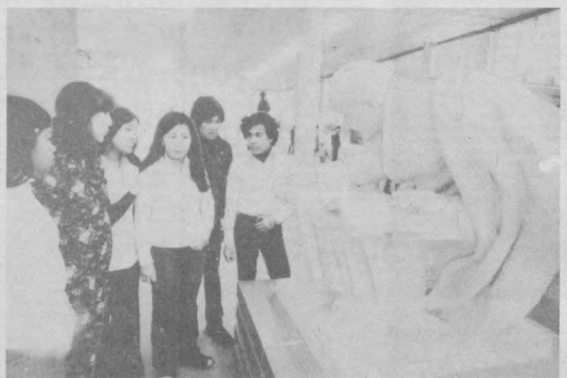
Школы интернационального братства и рабочего сотрудничества. Зарубежные юноши и девушки, как и их советские сверстники, находятся на полном государственном обеспечении. Несколько лет назад за подготовку высококвалифицированных рабочих кадров училище было награждено орденом Дружбы Вьетнама. На снимке: вьетнамские учащиеся на экскурсии в музее Ленина.

С. ЭЛЬЧИКОВА, Старший научный сотрудник Ташкентского филиала Центрального музея В. И. Ленина.