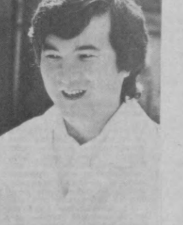
ВОЗВРАЩАЯ ЛЮДЯМ ЗРЕНИЕ