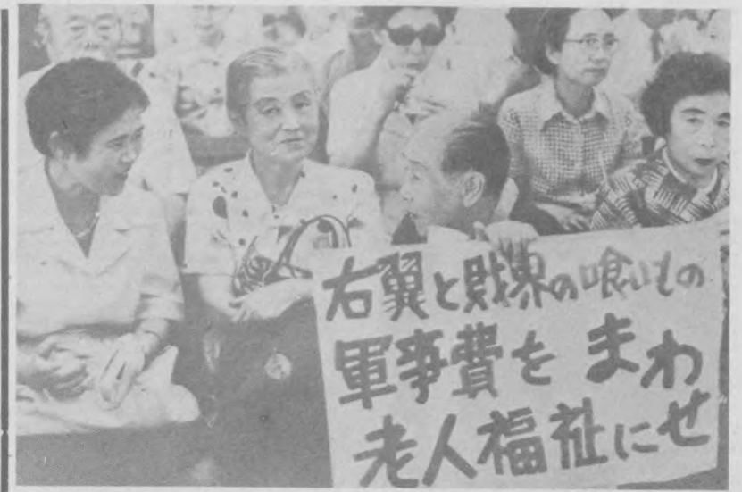
Подвальные большинство японцев старше 50 лет со страхом ждут того момента, когда в соответствии с трудовыми контрактами их уволят по возрасту. Две трети из них будут получать пенсию меньше десяти процентов своей прежней зарплаты.