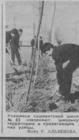
Учащиеся ташкентской школы № 83 озабочены школьной территорией и прилегающей к ней улицей.

Созданные рабочими крупными промышленными предприятиями в 1918—1922 годах группы помощи милиции назывались по-разному. Дружину содействия милиции — в Сибири, комиссии общественной помощи — в Петрограде, а в Туркестане — рабочие и партийные дружины. В героическую летопись защиты завоеваний революции немало славных страниц вписали дружины Ташкента, Коканда, Намангана и других городов.