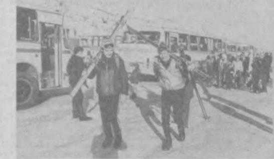
Воскресный день в горах Чингана.

Весть о случившемся бедствия в афганском кишлаке долетела до советской воинской части. По сигналу