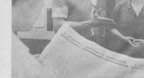
Живой отклик вызвал доклад М. С. Горбачева на Пленуме Центрального Комитета Коммунистической партии Советского Союза. На СНИМКЕ: обсуждение материалов Пленума ЦК КПСС в Ташкентской типографии издательства «Матбуот».

ет простор нашим инициативам. И в этом есть крайняя необходимость. Сейчас, например, в Кагане новую квартиру или улучшения жилищных условий ждут 3.034 семьи из 12.800. К 2000 году город будет населять 17 тысяч семей, и каждая должна иметь свою квартиру или дом. То есть, решая жилищный вопрос, горсовету придется и самому прибавить в работе, и потягивать строительные организации.