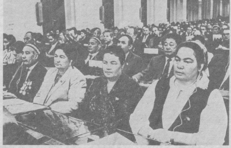
Депутаты из Узбекской ССР в зале заседаний.

М. С. Горбачев выразил признательность за поддержку генеральным секретарем ООН советского моратория на ядерные испытания, подчеркнул, что СССР и сейчас готов возобновить мораторий, если к нему присоединятся США. Напомнил об инициативе «группы шести», о том, что Советский Союз согласен на инспекции по