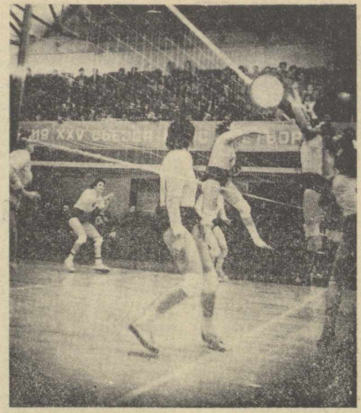
Бу йилги чемпионат ҳар жиҳатдан кескин ва шиддатли бўлиши кутилмоқда, — деган эди автомобилист номандаси...