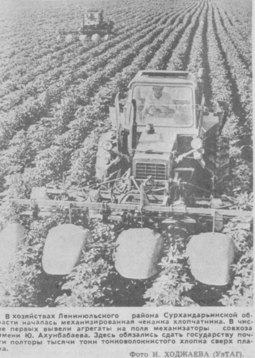
В хозяйствах Ленинпольского района Сурхандарьинской области началась механизированная работа хлопчатника. В числе первых вывели агрегаты на поля механизаторы совхоза имени Ю. Ахунбаева. Здесь обязались сдать государству почти полторы тысячи тонн тонковолокнистого хлопка сверх плана.