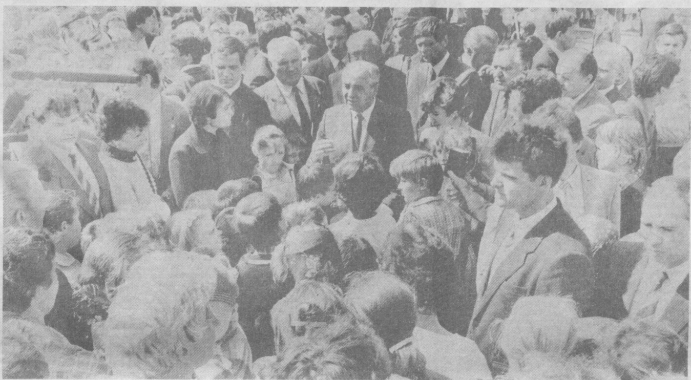
На снимке: во время встречи с жителями центральной усадьбы колхоза «Борец».

5 августа Генеральный секретарь ЦК КПСС М. С. Горбачев посетил агропромышленный комбинат «Раменский», расположенный в Московской области.