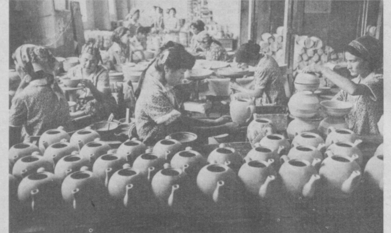
Популярностью у покупателей пользуется продукция Шерабадского керамического завода (Сурхандарьинская область): посуда, чайные наборы, другие сувенирные изделия из керамики. НА СНИМКЕ: на участие росписи предприятия.