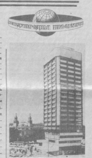
9 сентября — День свободы, национальный праздник Народной Республики Болгарии. София — крупный промышленный, культурный и научный центр страны. Динамичное развитие города полностью отвечает девизу, начертанному на его гербе: «Растет, но не стареет». НА СНИМКЕ: здание Центрального совета болгарских профессиональных союзов в Софии.

Об этом было сообщено на пресс-конференции, состоявшейся 7 сентября в пресс-центре МИД СССР. Перед советскими и иностранными журналистами выступил председатель оргкомитета выставки-ярмарки, председатель Госкомиздата СССР М. Ф. Ненашев. (ТАСС).