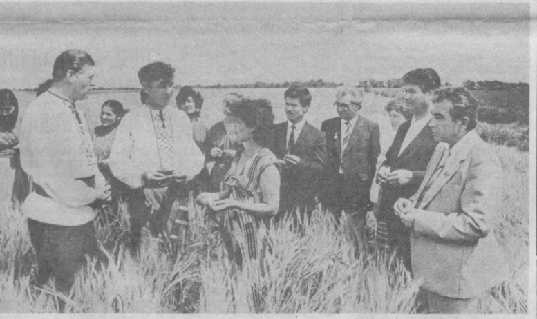
Этот снимок, запечатлевший артистов узбекской народной капеллы в поле, часто встречается с сельскими тружениками, старается прикоснуться к истокам подлинно народного искусства. Вот и в совхозе «Радса» Николаевского района Николаевской области они подружались с участниками художественной самодеятельности хозяйства.