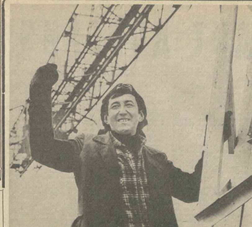
Значительно перенрты выработку в день «красной субботы» и переменить средства фонд пятилетия решил коллектив Нукусского ремонтно-механического завода.