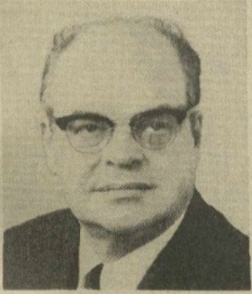
Н. Г. БАСОВ, Член Президиума Верховного Совета СССР.