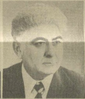
Б. Е. САРКИСОВ, Заместитель Председателя Президиума Верховного Совета СССР.