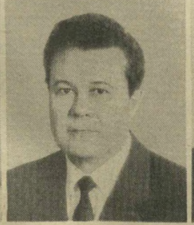
Г. Н. УСМАНОВ, Член Президиума Верховного Совета СССР.