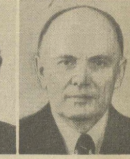
Б. Е. ПАТОН, Заместитель Председателя Совета Союза Верховного Совета СССР.