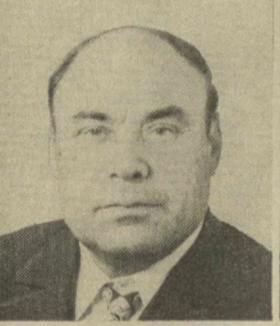
А. В. ГИТАЛОВ, Член Президиума Верховного Совета СССР.