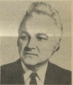
А. Ф. РЮИТЕЛЬ, Заместитель Председателя Президиума Верховного Совета СССР.