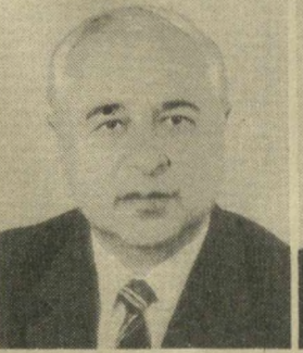
И. Б. УСМАНХОДЖАЕВ, Член Президиума Верховного Совета СССР.