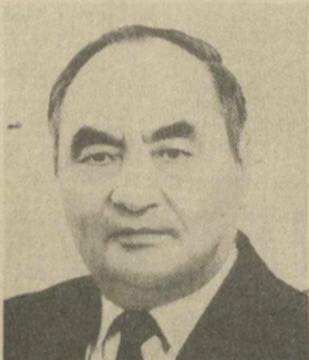
Б. А. АНИМОВ, Заместитель Председателя Президиума Верховного Совета СССР.