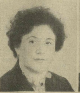
Н. П. РЫЖОВА, Член Президиума Верховного Совета СССР.