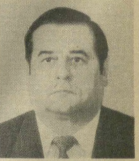
Р. Н. СТАХЕЕВ, Член Президиума Верховного Совета СССР.