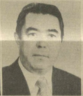
Б. ЯЗКУЛИЕВ, Заместитель Председателя Президиума Верховного Совета СССР.