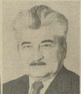
П. Г. ГИЛАШВИЛИ, Заместитель Председателя Президиума Верховного Совета СССР.