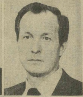
В. М. МИШИН, Член Президиума Верховного Совета СССР.