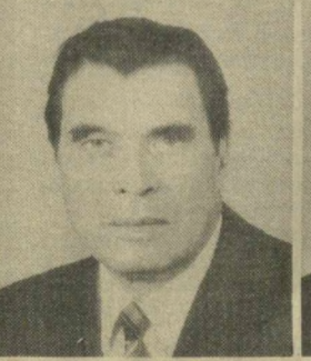
С. А. ПАЛАЕВ, Член Президиума Верховного Совета СССР.