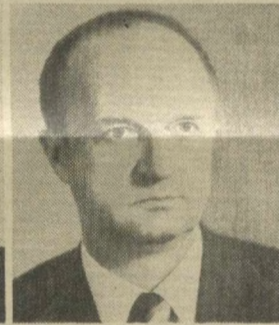
П. Я. СТРАУТМАНИС, Заместитель Председателя Президиума Верховного Совета СССР.