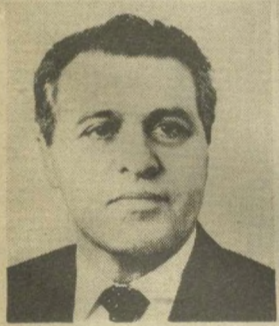
Т. Н. МЕНТЕШАВИЛИ, Секретарь Президиума Верховного Совета СССР.