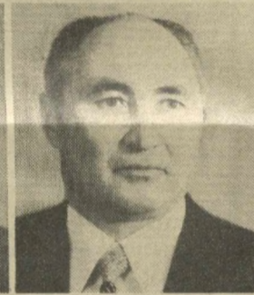
Т. Х. КОШОВ, Заместитель Председателя Президиума Верховного Совета СССР.