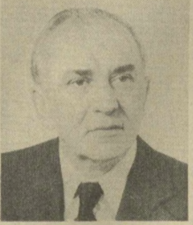
В. В. ГРИШИН, Член Президиума Верховного Совета СССР.