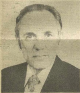
А. С. БАРКАУСКАС, Заместитель Председателя Президиума Верховного Совета СССР.