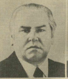
Н. Н. СЛЮНЬКОВ, Член Президиума Верховного Совета СССР.