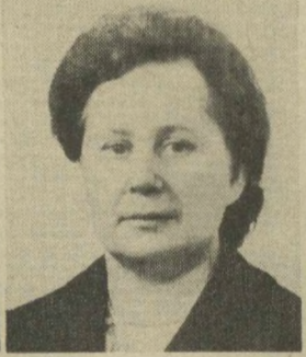
Р. А. ГАВРИЛОВА, Член Президиума Верховного Совета СССР.