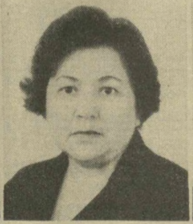
Н. П. ОТКЕ, Член Президиума Верховного Совета СССР.