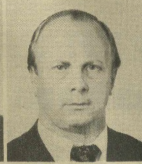
Н. А. ЗЛОБИН, Член Президиума Верховного Совета СССР.