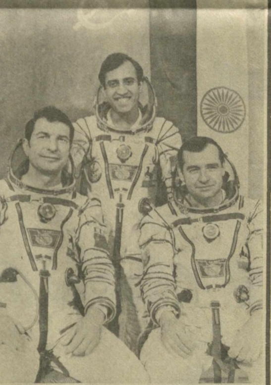
На снимке: советско-индийский космический экипаж — индийский космонавт Ракеш Шарма (в центре), летчик-космонавт СССР Героя Советского Союза Ю. В. Малышев (слева) и летчик-космонавт СССР Героя Советского Союза Г. М. Стрекалов.

ского материаловедения на технологической установке «Испаритель» выполнен ряд экспериментов по изучению процессов теплообмена и возможности получения аморфных металлических материалов в невесомости. Значительная часть научной программы была отведена медицинским исследованиям. В ходе выполнения экспериментов «Валлистор», «Вектор», «Оптонез», «Профилактика», «Июга», «Мембрана», «Опрос», «Анкет» получена новая информация об особенностях адаптации организма человека к условиям космического полета. Результаты проведенных работ будут использованы для совершенствования методов и средств профилактики неблагоприятного воздействия невесомости, а также для определения оптимального режима труда и отдыха космонавтов. На всех этапах выполнения сложной и напряженной программы совместных исследований и экспериментов Леонид Кизим, Владимир Соловьев, Олег Атьков, Юрий Малышев, Геннадий Стрекалов и Ракеш Шарма работали с полным взаимопониманием и проявили высокое профессиональное мастерство. Успешно заверченный космический полет явился новым виллом в дальнейшее развитие советско-индийских дружественных отношений, еще раз продемонстрировал, что освоение космического пространства Советским Союзом в рамках национальной программы и в сотрудничестве с другими государствами проводится в мирных целях на благо всего человечества.