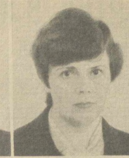
Е. Я. ЛОБАЧЕВА, Заместитель Председателя Совета Национальностей Верховного Совета СССР.