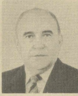
Л. Н. ТОЛКУНОВ, Председатель Совета Верховного Совета СССР.