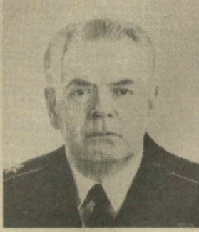
Г. М. ЕГОРОВ, Член Президиума Верховного Совета СССР.