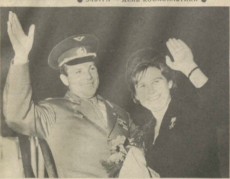
ПЕРВЫЕ В МИРЕ. Юрий Гагарин и Валентина Терешкова (1963 г.).