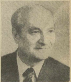
К. А. ХАЛИЛОВ, Заместитель Председателя Президиума Верховного Совета СССР.