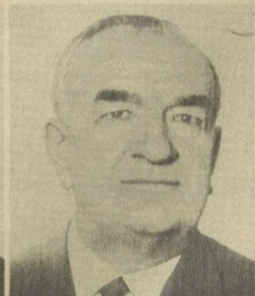
М. А. ЯСНОВ, Заместитель Председателя Президиума Верховного Совета СССР.