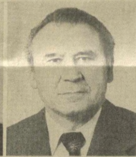
Г. ПАЛЛАЕВ, Заместитель Председателя Президиума Верховного Совета СССР.