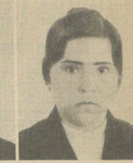
Ф. ТОИРОВА, Заместитель Председателя Совета Национальностей Верховного Совета СССР.