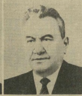
Д. А. КУНАЕВ, Член Президиума Верховного Совета СССР.