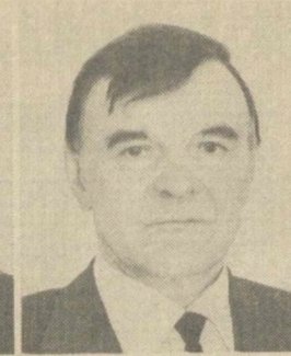
Ю. В. БОНДАРЕВ, Заместитель Председателя Совета Национальностей Верховного Совета СССР.