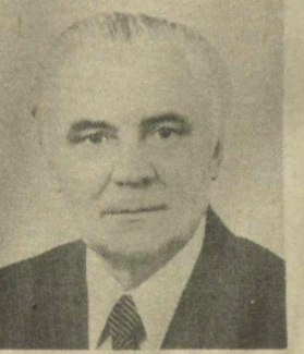
В. В. ПЕРЫЦКИЙ, Член Президиума Верховного Совета СССР.

Постановление Совета Национальностей Верховного Совета СССР О признании полномочий депутатов Совета Национальностей Рассмотрев представление Мандатной комиссии, Совет Национальностей в соответствии со статьей 110 Конституции СССР постановляет: Признать полномочия 749 депутатов Совета Национальностей, избранных 4 марта 1984 года. Москва, Кремль, 11 апреля 1984 г. Постановление Совета Союза Верховного Совета СССР О признании полномочий депутатов Совета Союза Рассмотрев представление Мандатной комиссии, Совет Союза в соответствии со статьей 110 Конституции СССР постановляет: Признать полномочия 750 депутатов Совета Союза, избранных 4 марта 1984 года. Москва, Кремль, 11 апреля 1984 г.