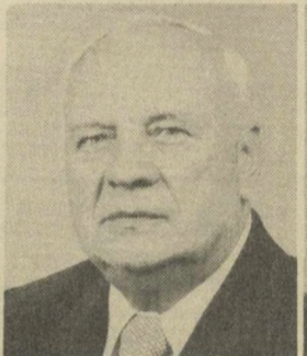
И. Е. ПОЛЯКОВ, Заместитель Председателя Президиума Верховного Совета СССР.