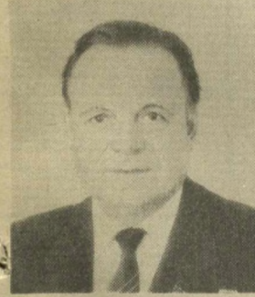
Л. Н. ЗАПКОВ, Член Президиума Верховного Совета СССР.