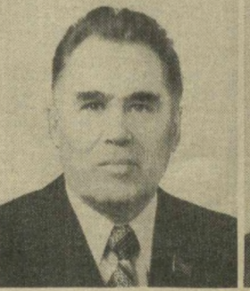
М. З. ШАКИРОВ, Член Президиума Верховного Совета СССР.