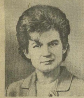
В. В. ТЕРЕШКОВА, Член Президиума Верховного Совета СССР.