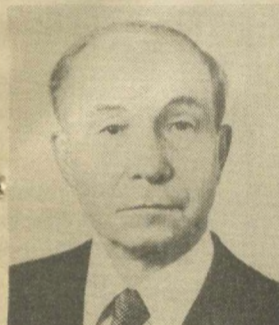
В. В. КУЗНЕЦОВ, Первый заместитель Председателя Президиума Верховного Совета СССР.