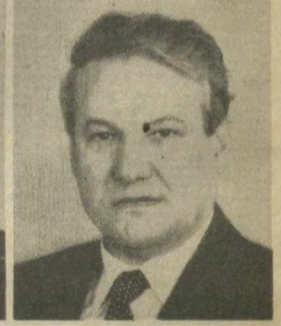
Б. Н. ЕЛЬЦИН, Член Президиума Верховного Совета СССР.