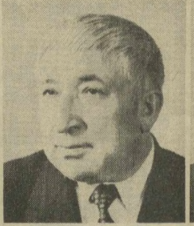
Р. Г. ГАМЗАТОВ, Член Президиума Верховного Совета СССР.