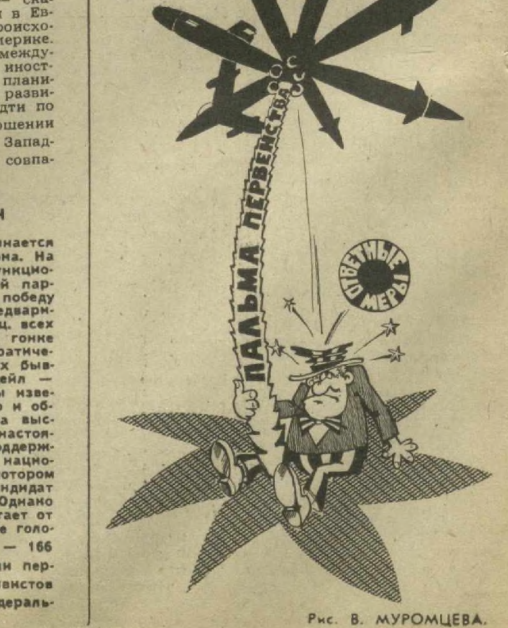
Рис. В. МУРОМЦЕВА.

В Соединенных Штатах начинается новый раунд предвыборного марафона. На толику что прошедших собраний функционеров и активистов демократической партии в штате Юта убедительную победу одержал сенатор Г. Харт. По предварительным данным, он получил 61 проц. всех голосов, а его главный соперник в гонке за выдвижение кандидатом от демократической партии на ноябрьских выборах бывший вице-президент США У. Мондейл.