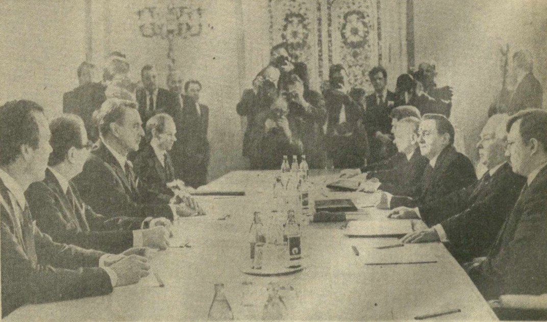
Во время беседы.

С обеих сторон была подчеркнута необходимость объединения усилий всех государств, как больших, так и малых, для понижения уровня вооруженной борьбы в Европе, возврата межгосударственных отношений в русло разрядки, создания атмосферы международного доверия и конструктивного сотрудничества, решения спорных проблем путем честных