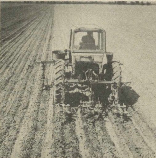
Земледельцы целинного совхоза имени Гафура Гуляма Ильичевского района Сырдарьинской области обязались в нынешнем году собрать с каждого гектара 30 центнеров