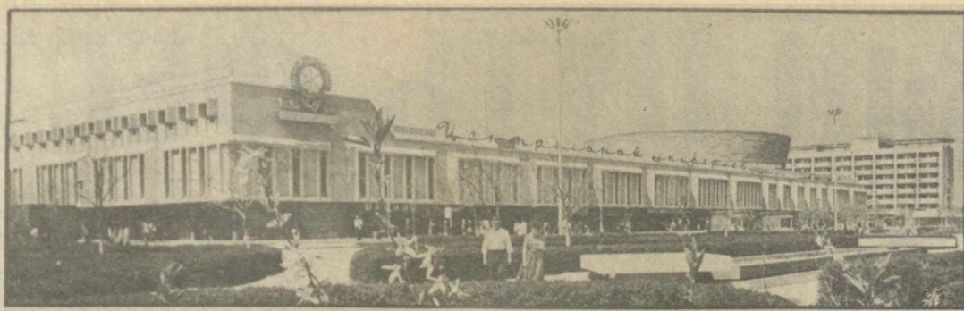
Центральный универсам в городе Навои.