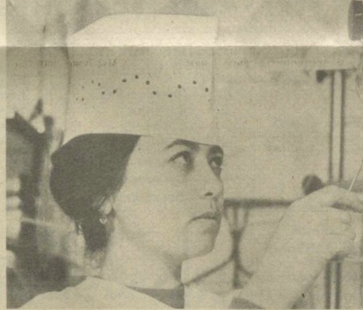
Жизнь десятков больных спасут врачи нового реанимационного отделения, созданного в Наманганской областной многопрофильной больнице. Здесь работают квалифицированные специалисты, в распоряжении которых новейшая медицинская техника и оборудова-

На Ташкентском агрегатном заводе внедрен производственный технологический процесс блестящего слабоокислого хлористого цинкования изделий ширпотреба. Цинк защищает основу металла в атмосферных условиях не только от механических, но и от электрохимических воздействий. Химическое пассивирование повышает стойкость покрытия и придает изделию декоративный вид. Внедрение нового технологического процесса позволило снизить трудоемкость за счет увеличения скорости покрытия в 1,5—2 раза, сократить затраты на приобретение дорогих и дефицитных химических веществ, повысить качество выпускаемой продукции. При этом годовой экономический эффект составляет 12 тысяч рублей. Процесс блестящего цинкования разработан учеными Института химии и химической технологии Академии наук Литовской ССР. С. ПОЛЫНОВА, И. ГРИГОРЬЕВ. (По материалам УНИИНИТ).