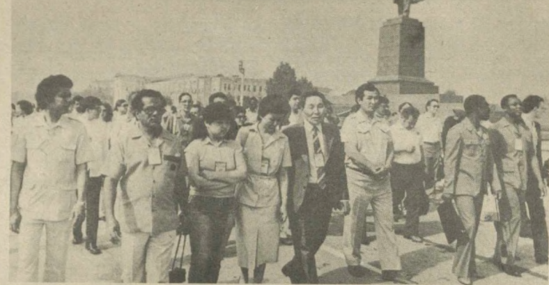
Участники и гости международного кинофестиваля на площади имени В. И. Ленина столицы Узбекистана.

На аэродроме его провожали член Политбюро ЦК КПСС, первый заместитель Председателя Совета Министров СССР, министр иностранных дел СССР А. А. Громыко, другие официальные лица. (ТАСС).