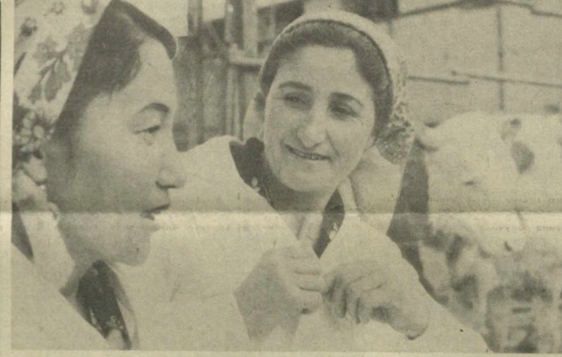
Животноводы совхоза «Социализм» Ворошиловского района Сырдаринской области добиваются высокой продуктивности отгонного комплекса. По итогам первого квартала нынешнего года в хозяйстве значительно перевыполнены плановые задания по всем видам животноводческой продукции — молока

Необходимо разрешить Министерству внутренних дел республики. На отгонные пастбища перенести главным образом взрослых овец, остальные, включая молодых, выпасать на тех пастбищах, которые в этот период травостой.