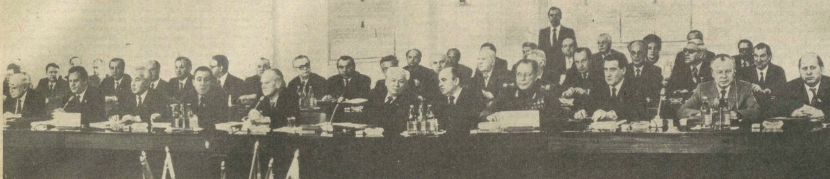
На снимке: делегация Союза Советских Социалистических Республик на совещании.