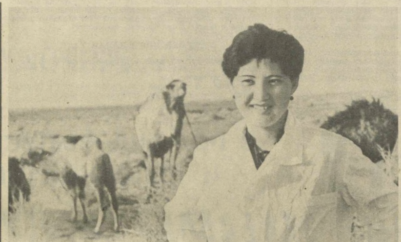
Совхоз «Айнал» Эллаклинского района ИККАССР...