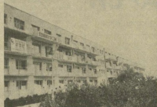
БУХАРСКИЙ ПЛАНОВО-ЭКОНОМИЧЕСКИЙ ТЕХНИКУМ [ул. Ленина, 282]

Дневное и заочное: технология приготовления пищи; товароведение и организация торговли промышленными товарами; товароведение и организация торговли продовольственными товарами; бухгалтерский учет в торговле.