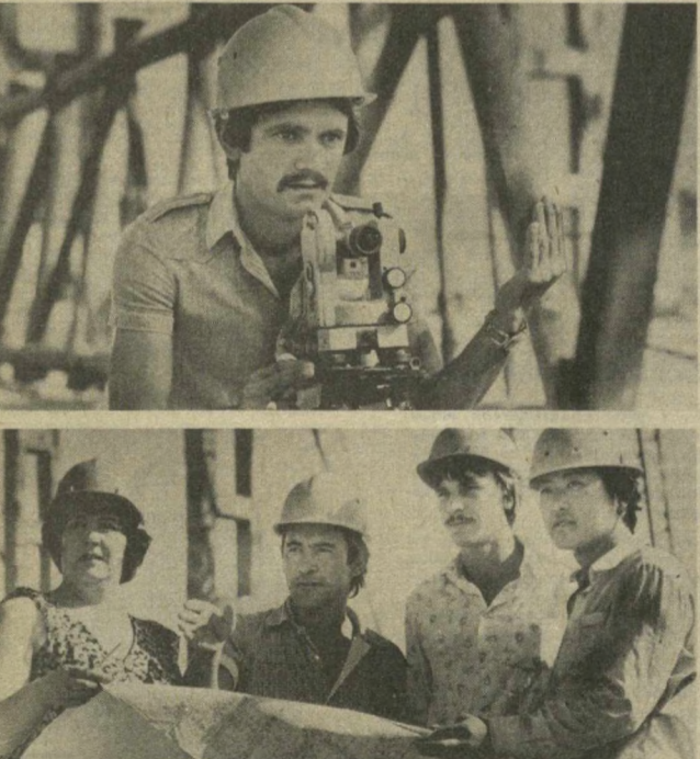
С маркой «ТМЗ»