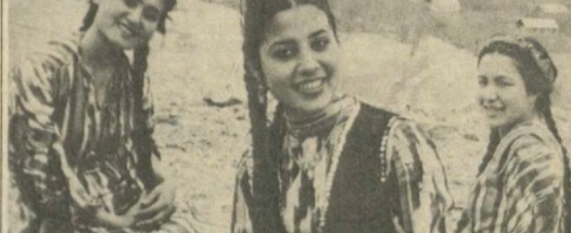
Новый ансамбль песни и танца «Дилшо» организован при ферганском Доме культуры № 1. Новый коллектив готовит большую концертную программу...