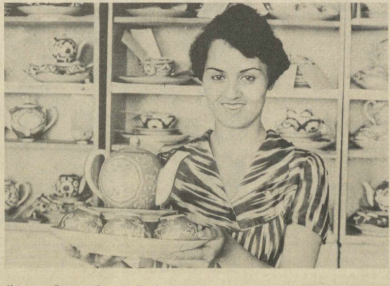
«Мохигула», «Гулюза», «Ешлини», «Динафруз» — так называют новые наборы посуды, выпускаемые на Кувасайском фарфоровом заводе...