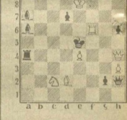
Мат в два хода (2 очка)