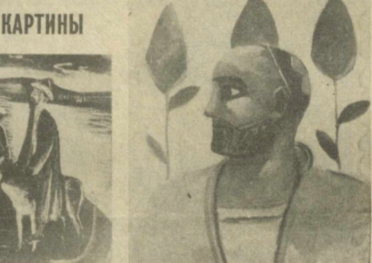
На снимках: «Строительство в Бухаре», «Переправа через Сырдарью», «Портрет узбечка».