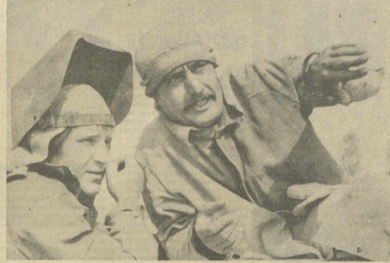
Значительно улучшит водообеспеченность столицы и ряды хозяйств Каракалпакской области водовод Ташкент — Нукус. На его трассе уже уложено несколько десятков километров труб. Основные сварочно-монтажные работы производит коллектив производственного объединения «Узтрансстрой».

На прошлой неделе космонавты выполнили несколько очередных серий геофизических исследований. По заданиям метеорологов, они вели наблюдения процессов, происходящих в атмосфере Земли, оперативно сообщали специалистам о зарождающихся циклонах.