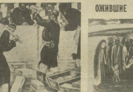
Более тысячи произведений искусства экспонируются в Москве на Всесоюзной выставке «Реставрация музейных ценностей в СССР».

ХАНКУЛАБАД. (Соб. корр.) Обновленным приняла отдыхающих в этом году городской парк культуры и отдыха.