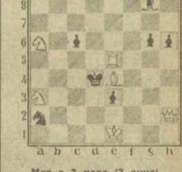
Мат в 3 хода (3 очка)

Повторите задачу шестого тура. Мат в два хода — белые Крe2, Фe8, Лh2, Лh2, Сс5, п.f3 (6), черные Крe5, Лf5, Крe5, п.e7 (4). Белые начинают и делают ничью — белые Крe6, Лf3 (2), черные Крf7, Сf8, п. e3, g2 (4).