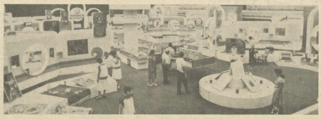
С ВЫСТАВКИ УМЕЛЫХ