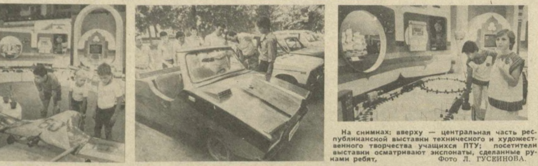
На снимках: сверху — центральная часть республиканской выставки технического и художественного творчества учащихся ПТУ; посетители выставки осматривают экспонаты, сделанные руками ребят...

«ЛАСТОЧКА» ОТПРАВЛЯЕТСЯ В ПУТЬ ТОВАРОВ НАРОДНОГО ПОТРЕБЛЕНИЯ — НА ПОЛТОРА МИЛЛИОНА САМАЯ ЭЛЕГАНТНАЯ ОДЕЖДА ЗА УЧИТЕЛЬСКИМ ПУЛЬТОМ — УЧЕНИК ТРИСТА ПРОФЕССИИ НА ВЫБОР