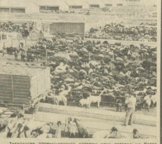
Технология промышленного откорма овец освоена на Коттагурганском специализированном комплексе. Это животноводческое предприятие способно принять в свои откормочники 32 тысячи старовозрастных и выбракованных каракульских овец.

Ленинградский район, Сурхандарьинская область.