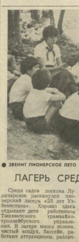
Звонят пионерское лето