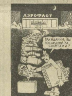
Гражданин, вы опоздали на билет!

женщину, обругать старика? На днях оказался свидетелем такой сцены. Ветеран войны, предьявляя удостоверение, хотел взять билет, как ему и положено, вне очереди. Кассе его, однако, не подпустили, но стали укорять администрацию ЦАВСа за то, что для ветеранов войны не выделена специальная касса. Внесу жалобу, заявил он, если вы можете оказаться под трехзначным номером, то, допустим, в очереди желающих приобрести билет до Симферополя вам предоставят цифру меньшего порядка. Ох, уж эти списки! Кому придумать в голову их составлять и откуда находить желающих в них записываться? Никто ведь не ведет, каким образом общее количество записавшихся распределяется по кассам. Мысль эта, вероятно, терзает каждого потенциального пассажира, и стоит только открыть двери ЦАВСа, как устремляется к билетному окошку. В этой борьбе, как написал в своем письме один из читателей нашей газеты, «побеждает тот, у кого крепче мускулы».