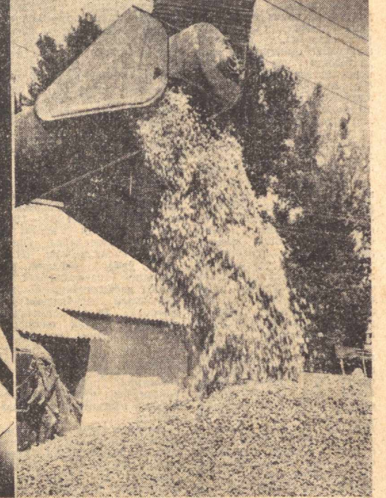
САБЗАВОТ ВА ПОЛИЗ

Хоразм области, Қорақалпоғистон АССР маккажўхориқорлари ҳам юқори ҳосил етиштирдилар. Улар ўрм-ийгини соатлар сайн авж олдиришмоқдалар. Ғанимат фурсатини кўпи кетиб ози қолди. Шундай экин, ҳамма жойда қолбайлар тўла ишга туширилиши, тўхтовсиз иштатилиши, илгор қолбайчиларнинг иш услуби ҳаммаинг мулкига айланганлиги, шундай қилиб, ўрм-ийгим ва дон тайёрлашда янги юксалтишга эришиш таъминлашнинг керак. Партия, совет, комсомол ташкилотлари, қишлоқ ҳўжалик органлари борлиқ ҳосилни сира нобуд ва исроф қилмасдан тезроқ ва сифатлироқ йиғиштириб олиш чораларини қўришлари лозим.