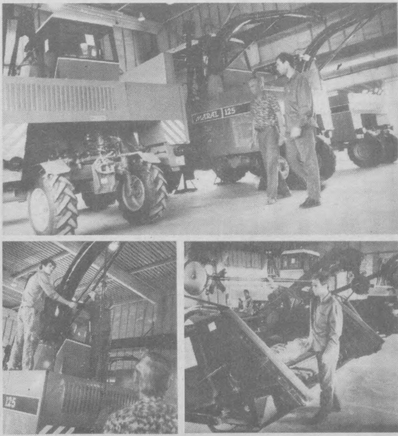
Узбекистан - Германия: грани сотрудничества

Юрий Гентшке. Соб. корр. "Правды Востока".