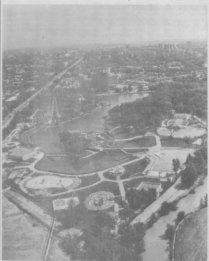
Ташкент с высоты птичьего полета - смотровой площадки ташкентской телевизионной башни.