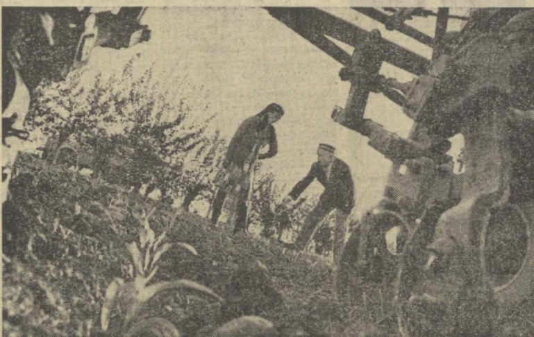
ДАСТЛАБКИ ПАРВАРИШ БОШЛАНДИ