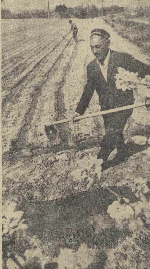
Урнбкй Қорабев гузага сув тараятп.