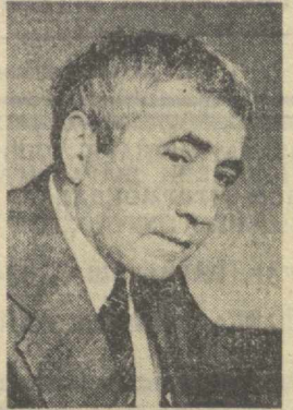
Станислав Стойков, Болгария Компартияси Марказий Комитетининг аъзоси, Болгария Фанлар академиясининг мухбир аъзоси, профессор.

Улуғ Октябрнинг 60 йиллиги ва СССРда пролетар интернационалиизмининг тантанаси мавзусидаги конференциянинг Тошкентда ўтказилишида жуда катта ҳақиқат бор. Мен бу ҳақиқатни Тошкентда турли миллат ақиллари бир оила фарқларидан инок шайт-ғанликларидан, шаҳар қардош-лик ва дўстлигининг муваззам масканига айланган колганлиги, да, унинг муттасил йиллик халқ-эро симпозиум, конференция ва фестиваллар ўтказилиб ту-риладиган мўътабар марказ бўлиб танилганлигида ва яна жуда кўп омиқларда чўраман. Тошкент, айниқса, 1966 йилги элзизладан сўнг қардош халқ-лар биродарлигининг ҳақиқий рамзи бўлиб қолди.