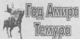
Год Амира Темура